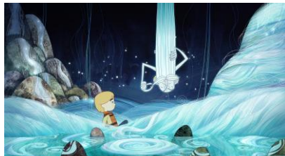
©Cartoon Saloon, Melusine Productions, The Big Farm, Superprod, Norlum